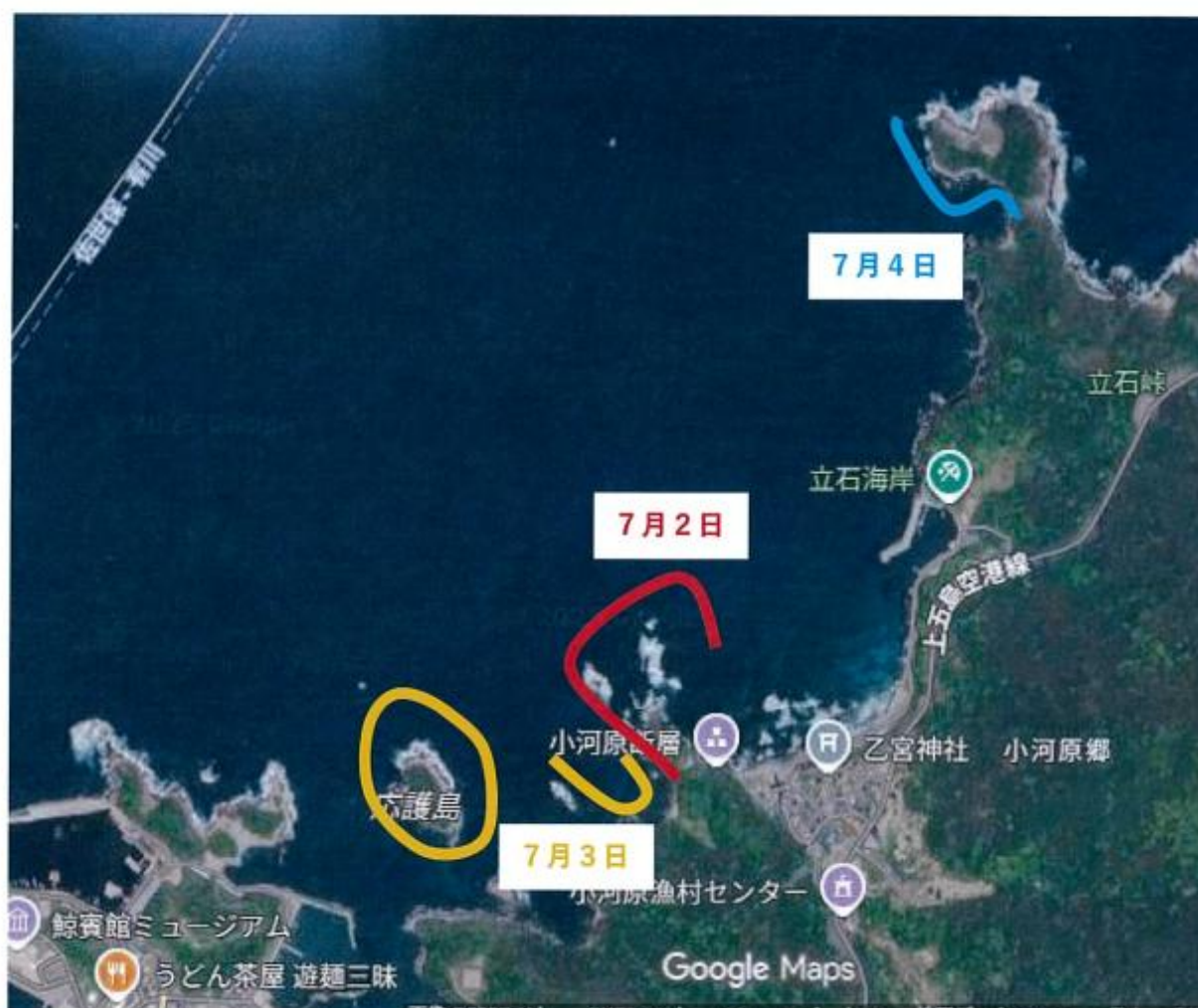
令和6年度 外敵駆除 位置図